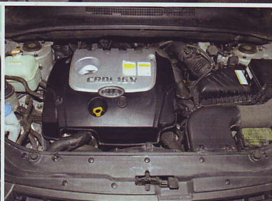
112 PS-starkes Diesel-Aggregat mit zufriedenstellender Leistungsentfaltung

mittlerweile von einer 140 PS-starken Version mit Partikelfilter abgelöst, einem Triebwerk, das auf ersten Testfahrten auch solche Steigungen souverän meisterte.