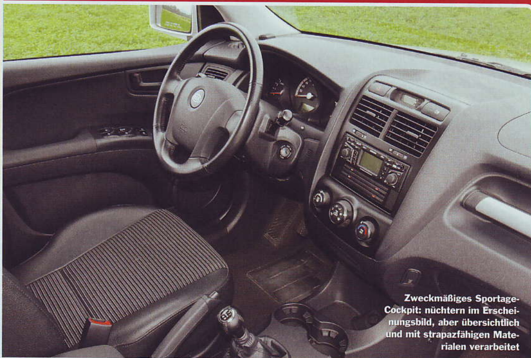
Zweckmäßiges Sportage-Cockpit: nüchtern im Erscheinungsbild, aber übersichtlich und mit strapazfähigen Materialien verarbeitet

Offroad-Hülle, Diesel-Fülle: Der frontgetriebene Kia Sportage erreichte das Intensivtest-Ziel ohne außerplanmäßige Werkstatt-Aufenthalte