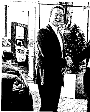
Benda hat Donnerstag bis 21.00 und am Samstag bis 17.00 h offen